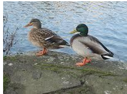
Nichée de canard Colvert