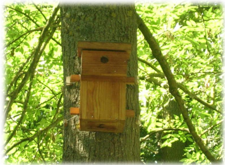
Nichoir à balcon