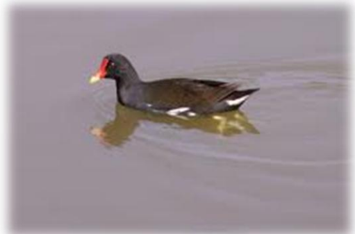
Nichée de poule d'eau Gallinulé