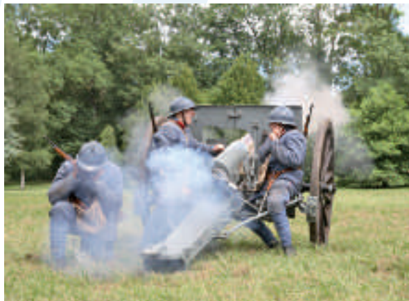
Mise en batterie du canon de 75 mm