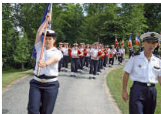
Le bagad de Lann Bihoué