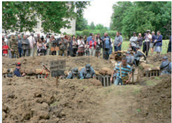
Reconstitution d'une tranchée par le Poilu de la Marne