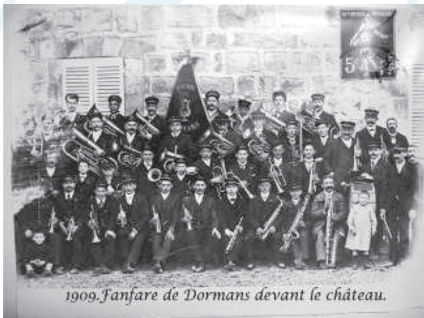
1909. Fanfare de Dormans devant le château.

D u 30 mai au 1er juin, la célébration du centenaire de la Musique Municipale a animé la ville.