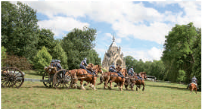
Le canon de 75 mm et son attelage de 6 chevaux

La journée se termina par un concert original offert par le bagad de Lann-Bihoué qui ravit les nombreux spectateurs rassemblés pour l'occasion sur l'esplanade du château.