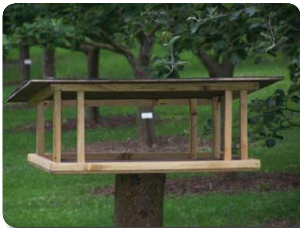
Mangeoire installée dans le verger conservatoire

La LPO sera présente les 10 et 11 octobre prochain pour la manifestation «Plantes, fleurs, légumes et fruits en fêtes» au château de Dormans.