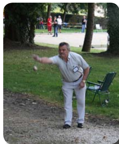
Le président de l'association montre l'exemple

La municipalité, très impliquée dans cette renaissance, souhaite longue vie à cette association locale : LA PÉTANQUE DORMANISTE.