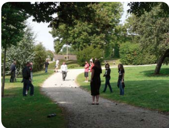
De nombreuses parties se sont déroulées dans les allées du parc tant il y avait affluence d'inscrits au concours.